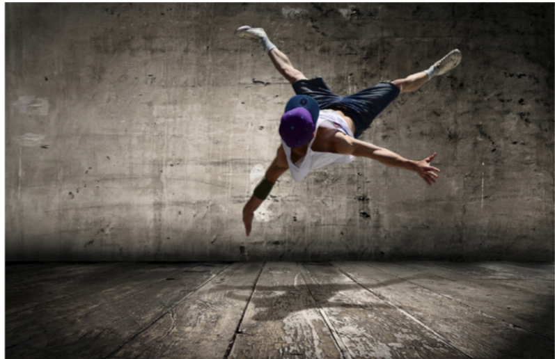
Figur 33.3 Breakdance. Det kræver ofte fremragende akrobatiske evner som her, hvor danseren laver et vildt move. Det kunne være i et battle, hvor man udfordrer hinanden med vilde moves og freezes.

Modsat den mere rytmiske hiphop-dans, består breakdance af mere akrobatiske bevægelser, der kræver fremragende teknik, styrke og balance. Rytmе og grundtrin er heller ikke helt ens i de to stilarter, og derfor bliver de også dækket i hver deres øvelseskategorier i kapitel 33.3 .