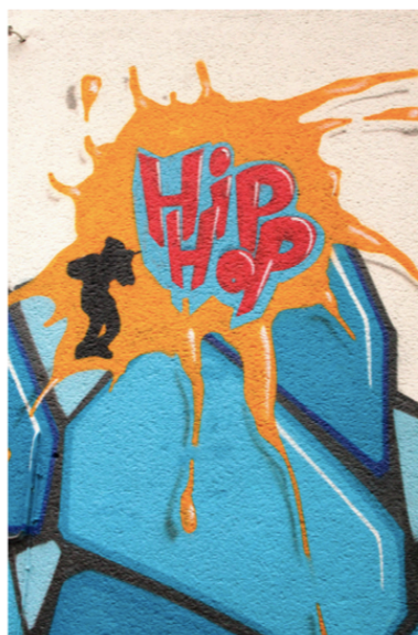
Figur 33.2 Graffiti er et af de 4 grundelementer indenfor hiphop. De andre er b-boying, DJ-ing og MC-ing. Se teksten for yderligere forklaring af disse fire elementer. Billedet er fra www.pixabay.com .