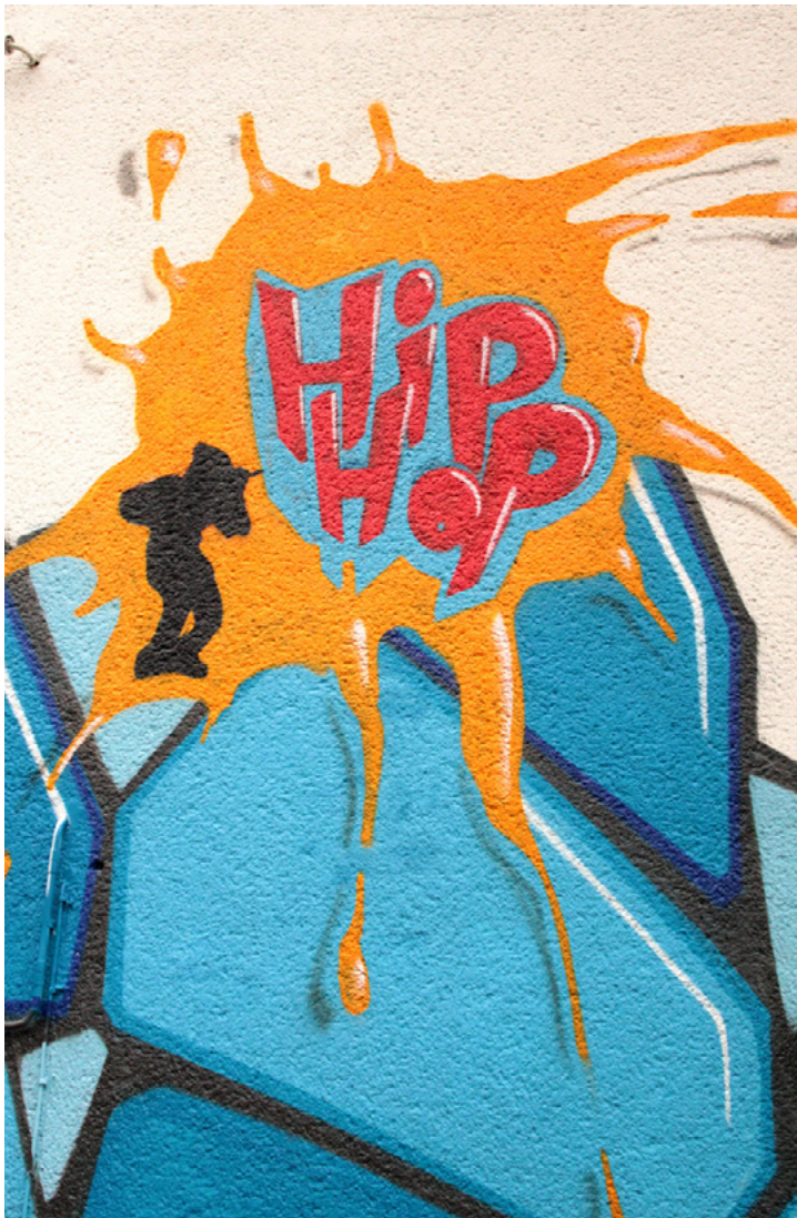
Figur 33.2 Graffiti er et af de 4 grundelementer indenfor hiphop. De andre er b-boying, DJ-ing og MC-ing. Se teksten for yderligere forklaring af disse fire elementer.

1) B-boying, som er breakdance og dermed det originale danse-element inden for hiphop